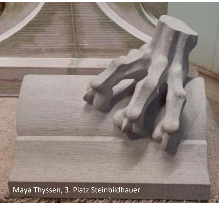
Maya Thyssen, 3. Platz Steinbildhauer