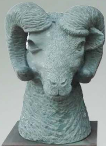
Levin Schnell, 1. Platz Steinbildhauer