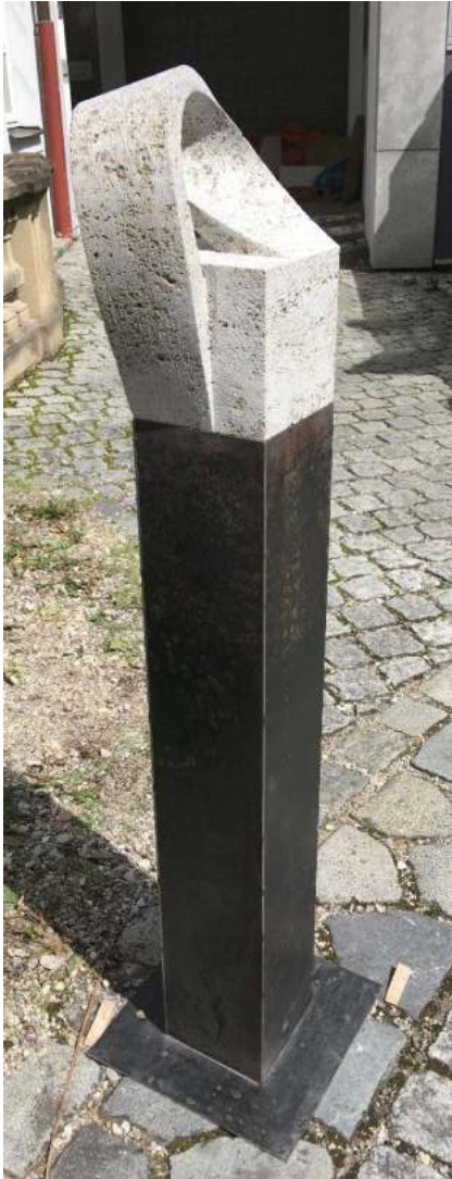
Matthias Imhof, 2. Platz Steinmetz