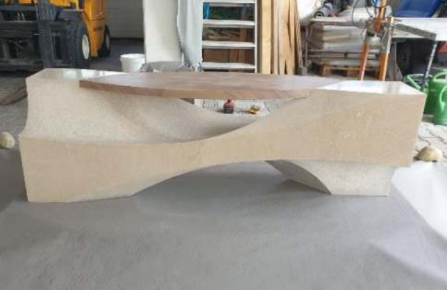
Bettina Buchner, 1. Platz Steinmetz